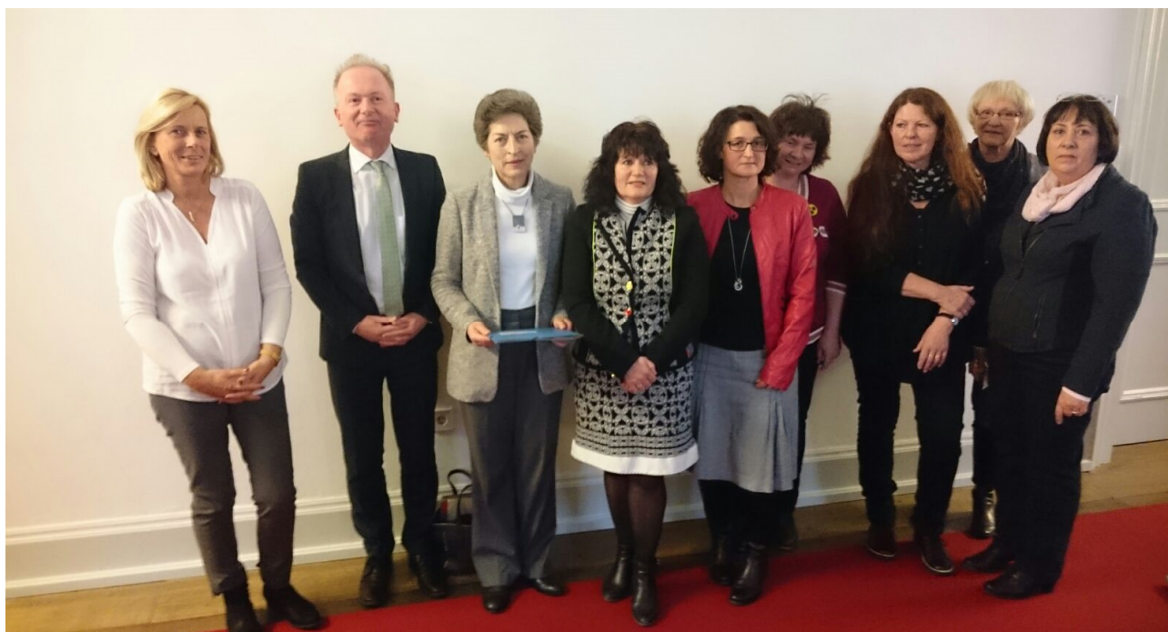
Preisträger der einzelnen Schularten