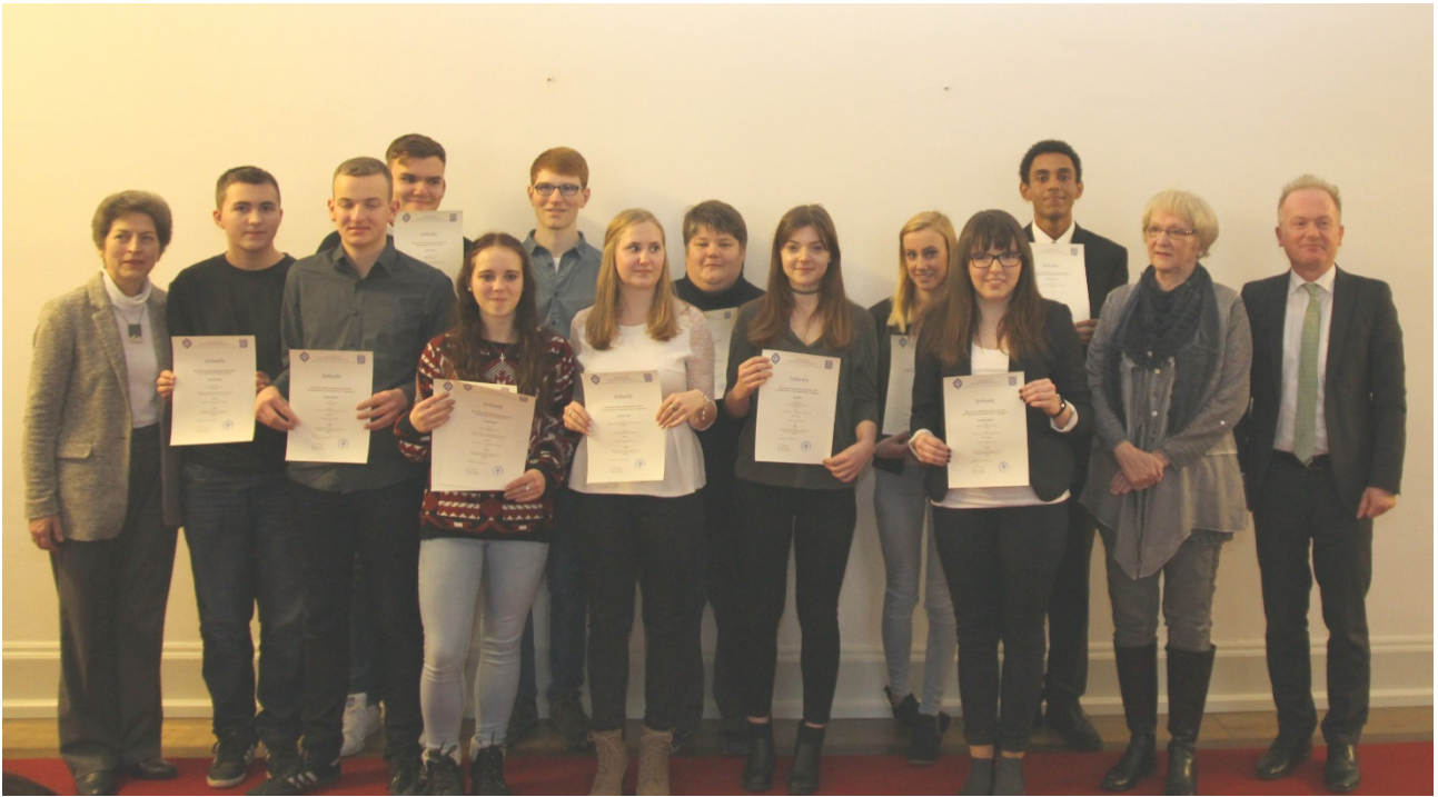
Die Landessieger(innen) des Bayerischen Schülerleistungsschreibens 2016