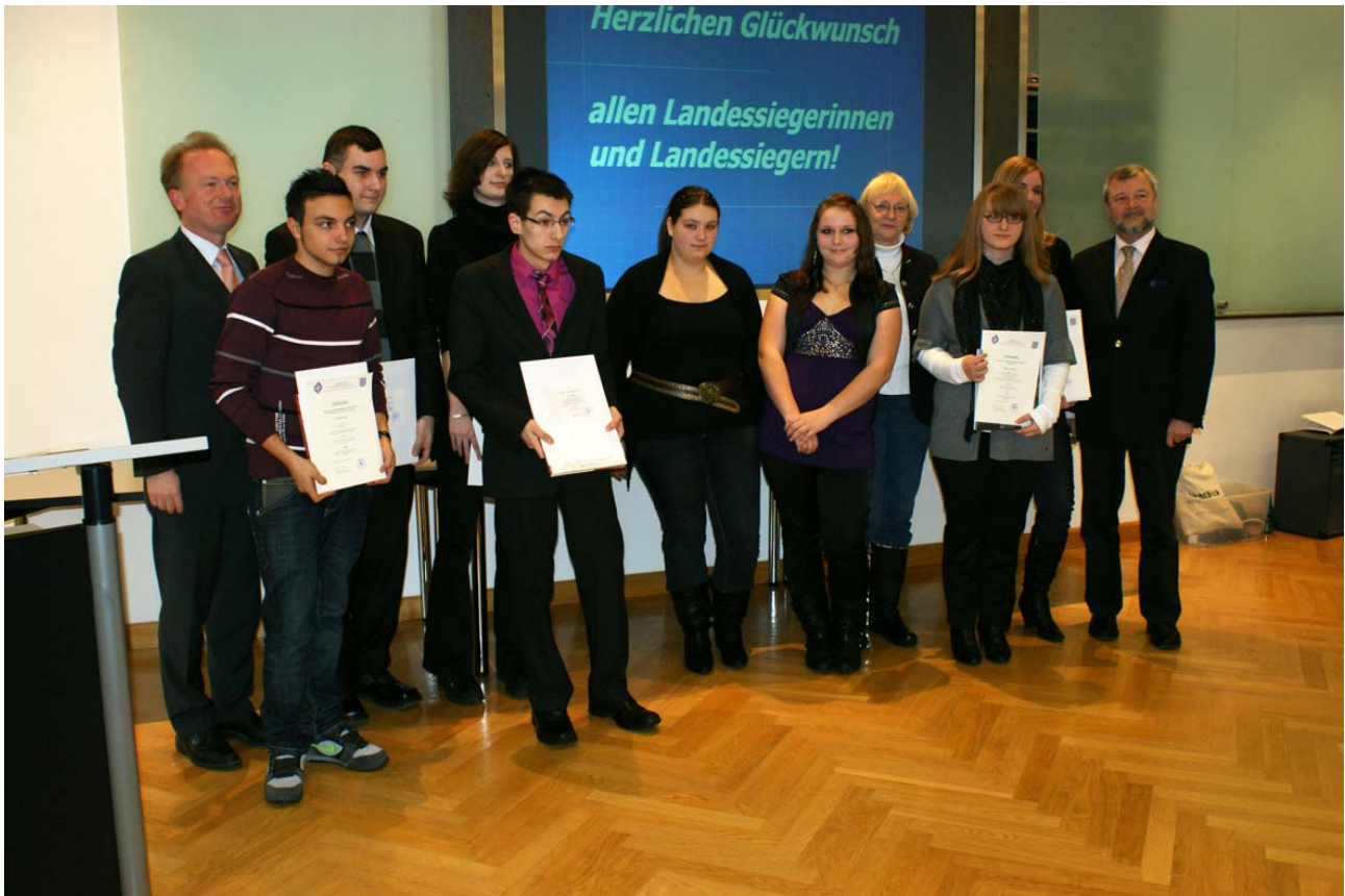
Die Landessieger(innen) des Bayerischen Schülerleistungsschreibens 2010